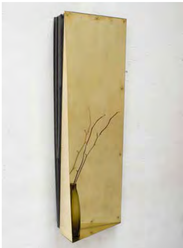
REINAART VANDERSLOTEN – SPACE+ PHOTO © ISABEL ROTTIERS