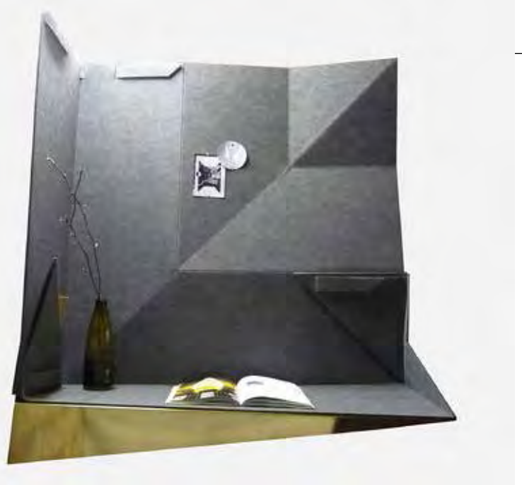
REINAART VANDERSLOTEN – SPACE+

Het grote verschil met de conventionele kamerschermen? Buiten gebruik, staan ze nooit nutteloos in een hoek want dat kost kostbare ruimte. Bij de Space+ wordt het scherm origami-opgevouwen. Bij de Plex+ kast verandert het scherm in een kastdeur.