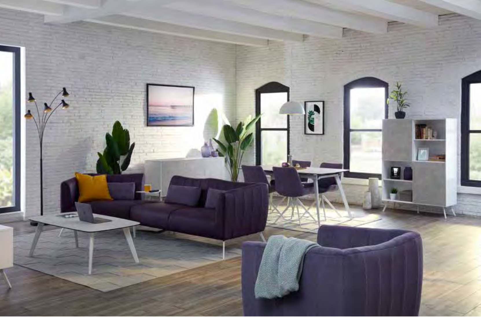
UP2DATE – CITY LIVING: SIDNEY