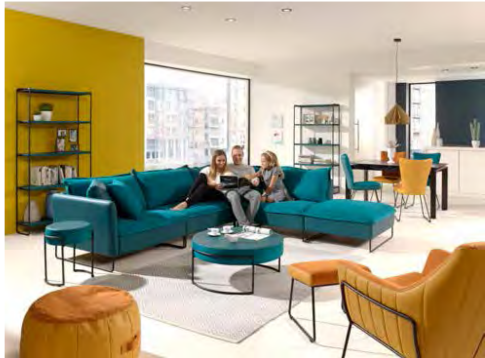
UP2DATE – CITY LIVING: NEW YORK