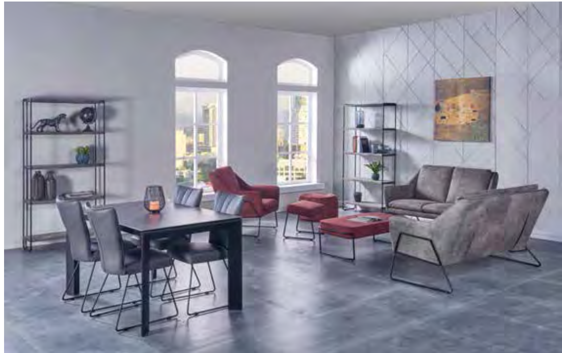
UP2DATE – CITY LIVING: LONDON